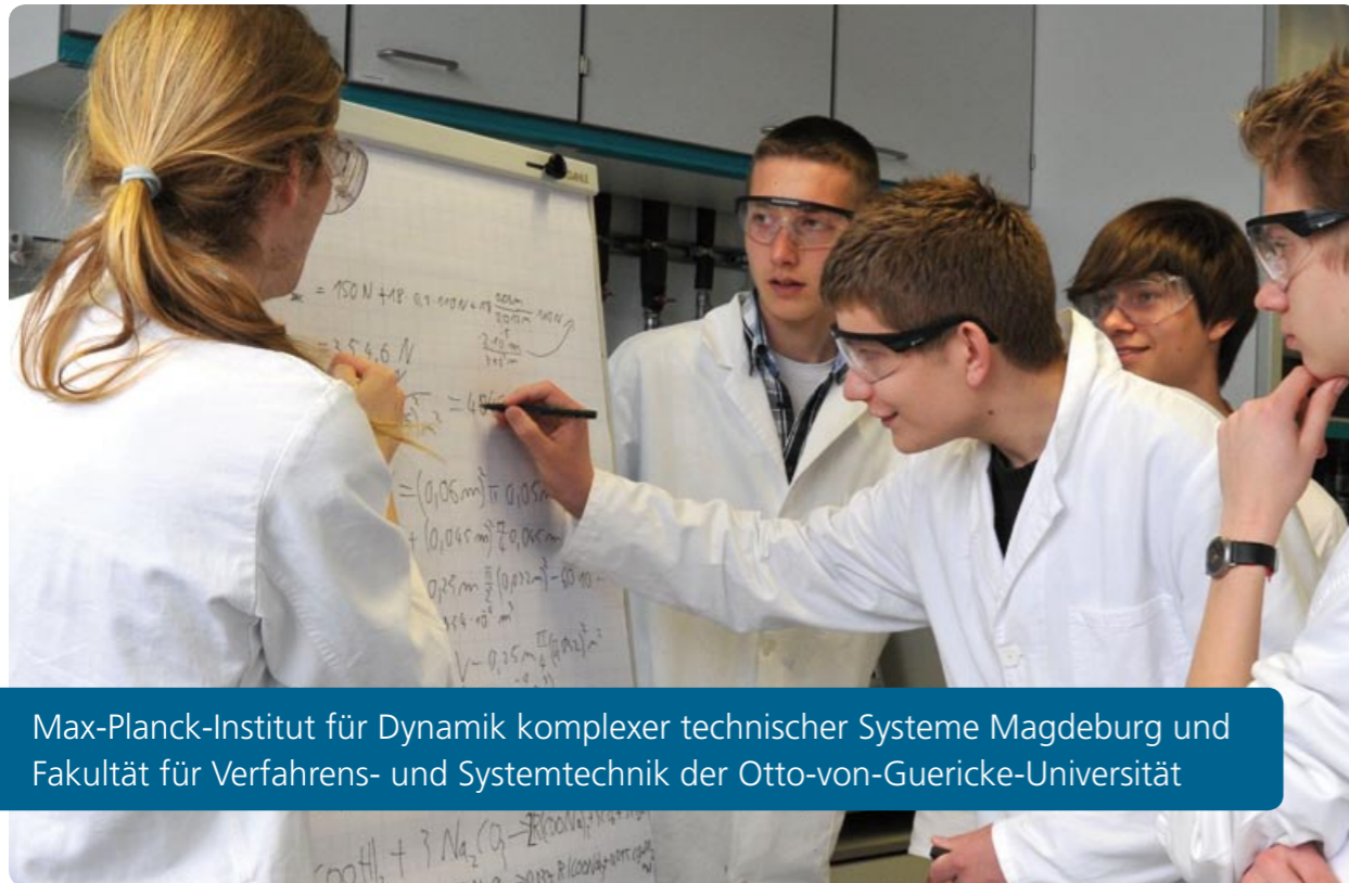
Max-Planck-Institut für Dynamik komplexer technischer Systeme Magdeburg und Fakultät für Verfahrens- und Systemtechnik der Otto-von-Guericke-Universität

Viele Schülerinnen und Schüler möchten nach dem Abitur "mal irgendwas mit Bio, Chemie oder Mathe machen". Sie wissen aber noch nicht genau, wofür sie sich entscheiden sollen. Die Erfahrungen, die sie während des Praktikums „Verfahrenstechnik und Technische Kybernetik“ machen, helfen ihnen, die Weichen für die Studien- und Berufswahl zu stellen. Das Praktikum findet jeweils in den Oster- und Herbstferien des Landes