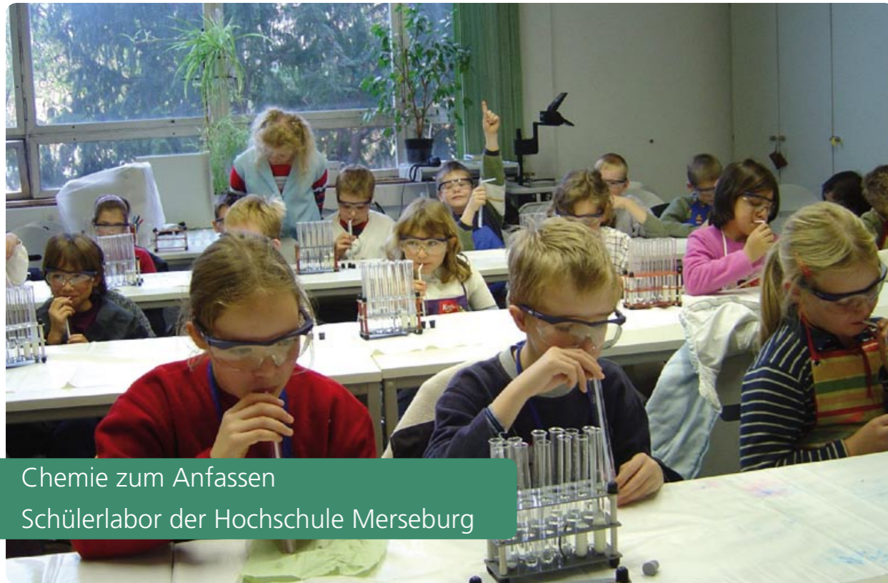
Chemie zum Anfassen Schülerlabor der Hochschule Merseburg

Schülerinnen und Schüler der Grund- und Sekundarschulen sowie der Gymnasien haben die Möglichkeit, Naturwissenschaften an einer Hochschule zu erleben und unter dem Motto Staunen - Experimentieren - Erleben - Verstehen eigenständig Versuche durchzuführen. Für die praktische Laborarbeit wurden altersgerechte und am Alltag, an der aktuellen Forschung und am Schulstoff orientierte Versuchsreihen entwickelt. Eigenständiges Arbeiten in Zweiergruppen, das konzentrierte