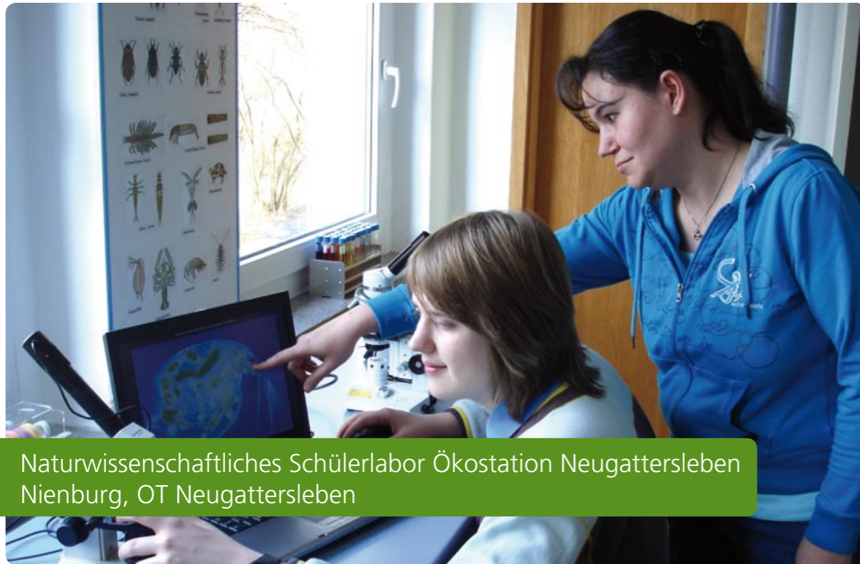
Naturwissenschaftliches Schülerlabor Ökostation Neugattersleben Nienburg, OT Neugattersleben

Im Zentrum des Salzlandkreises befindet sich die Ökostation Neugattersleben, die seit September 1992 in Sachsen-Anhalt als anerkanntes Umweltbildungszentrum tätig ist.