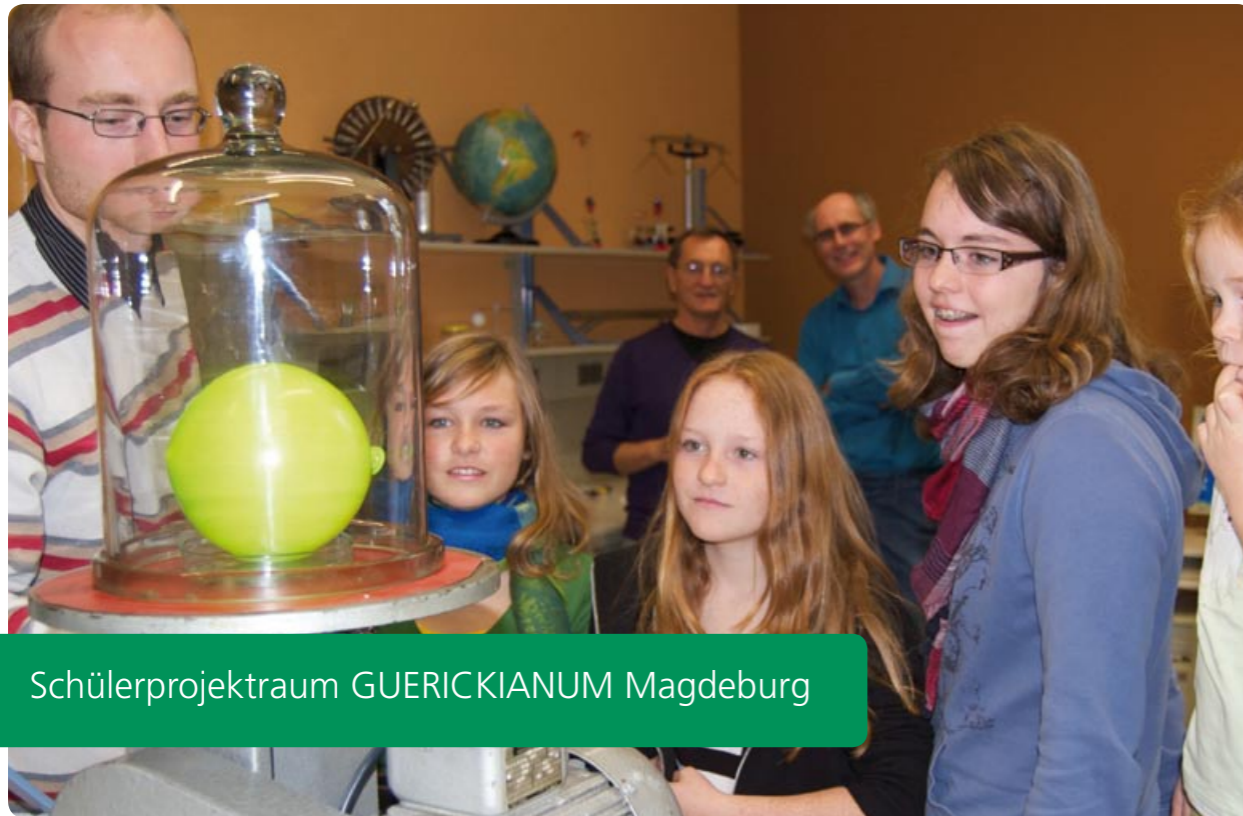
Schülerprojektraum GUERICKIANUM Magdeburg

Der Schülerprojektraum ist Teil des Guerickezentrums und pflegt das naturwissenschaftliche Erbe OTTO VON GUERICKE in enger Verbindung zum naturwissenschaftlichen Unterricht. Er versteht sich als außerschulischer authentischer Lernort insbesondere für Schülerinnen und Schüler der Magdeburger Region. Im Mittelpunkt der lebens- und umweltbezogenen Projekte stehen ausgewählte Guericke-Experimente, eine selbständige Experimentiertätigkeit der Teilnehmer und weitere wesentliche naturwissenschaftliche Denk- und Arbeitsweisen.