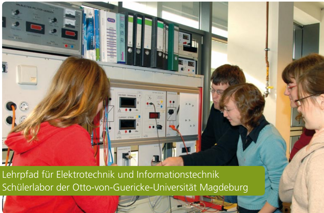
Lehrpfad für Elektrotechnik und Informationstechnik Schülerlabor der Otto-von-Guericke-Universität Magdeburg

Der Lehrpfad Elektrotechnik und Informationstechnik an der Otto-von-Guericke-Universität in Magdeburg ist auf die Durchführung unterrichtsbegleitender Experimente, die Gestaltung von Projektwochen und Exkursionen ausgelegt.