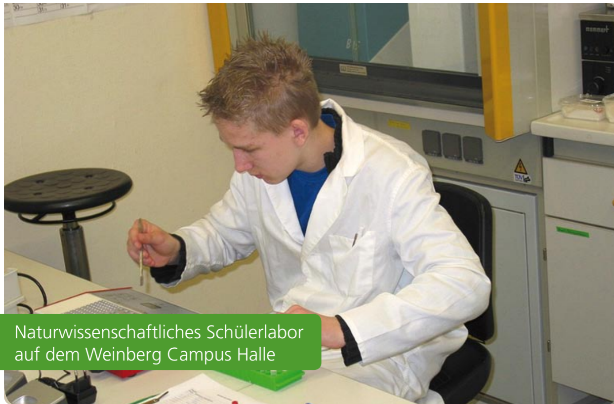
Naturwissenschaftliches Schülerlabor auf dem Weinberg Campus Halle

Das Schülerlabor ist eine gemeinsame Initiative des Biozentrums der Martin-Luther-Universität Halle-Wittenberg und dem Verein „weinberg campus e.V.“