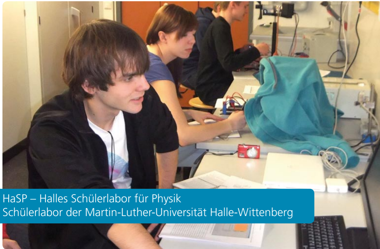
HaSP – Halles Schülerlabor für Physik Schülerlabor der Martin-Luther-Universität Halle-Wittenberg

Das Schülerlabor des Instituts für Physik der Martin-Luther-Universität Halle-Wittenberg wurde im Januar 2011 eröffnet. Die Arbeit des Schülerlabors wird durch die Wilhelm und Else Heraeus-Stiftung unterstützt.