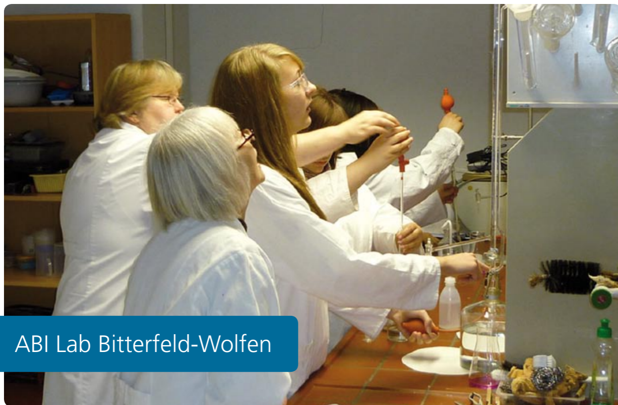
ABI Lab Bitterfeld-Wolfen

Das Schülerlabor steht Schülern der Grund- und Sekundarschulen sowie Gymnasien offen, die Interesse am Experimentieren haben und ihre Fähigkeiten in der Laborarbeit testen möchten.